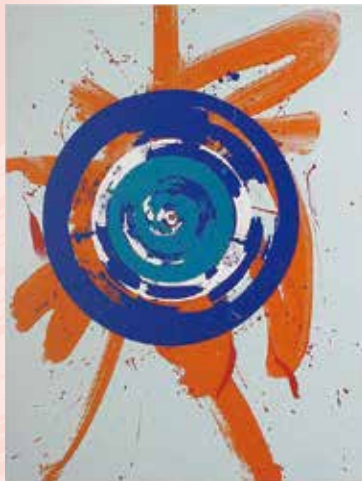
《オレンジの中の円》