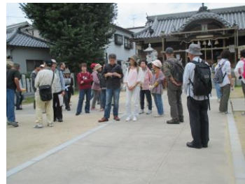
近松健康ウォーク

この他にも寄席、ゴルフ大会、演劇、将棋大会、読書会などいろいろな事業があります☆彡