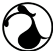
近松のまち・あまがさき

尼崎ゆかりの劇作家・近松門左衛門が生きた時代とその作品を象徴する「マゲ」と尼崎市のローマ字の頭文字「a」をデザイン化したものです。