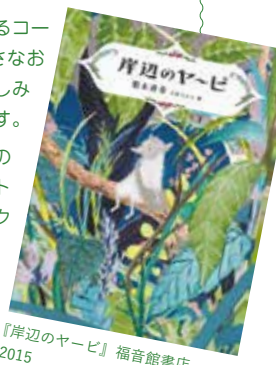
『岸辺のヤービ』福音館書店 2015