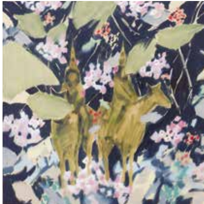
《どうして真夜中が続く》2017*