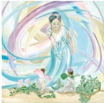
『よんひやくまんさいのびわごさん』理論社 2020