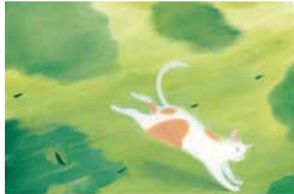
『チャーちゃん』福音館書店 2015