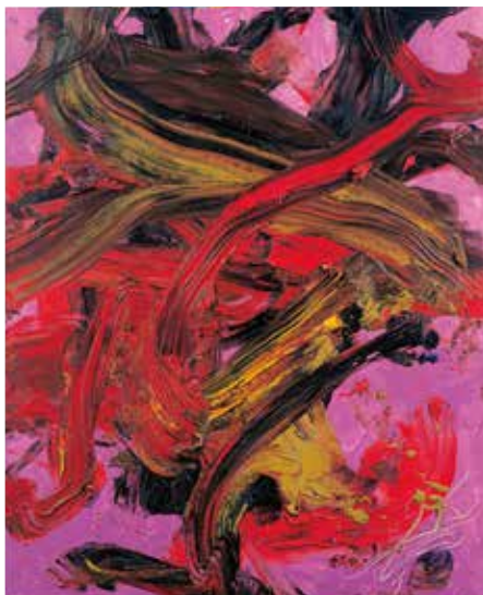
白髪一雄「天女の舞」2000年 尼崎市蔵 ※この作品は後期 [7/20(水)-9/25(日)] に展示予定。