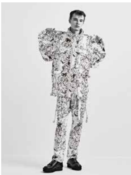
ブルゾン&ユーティリティパンツ/白髪一雄「鳥福慈摩明王」1984年 個人蔵