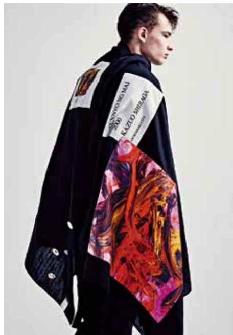
ストール/白髪一雄「天女の舞」2000年 尼崎市蔵