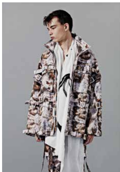
ブルゾン/白髪富士子「無題」1960年 大阪中之島美術館蔵