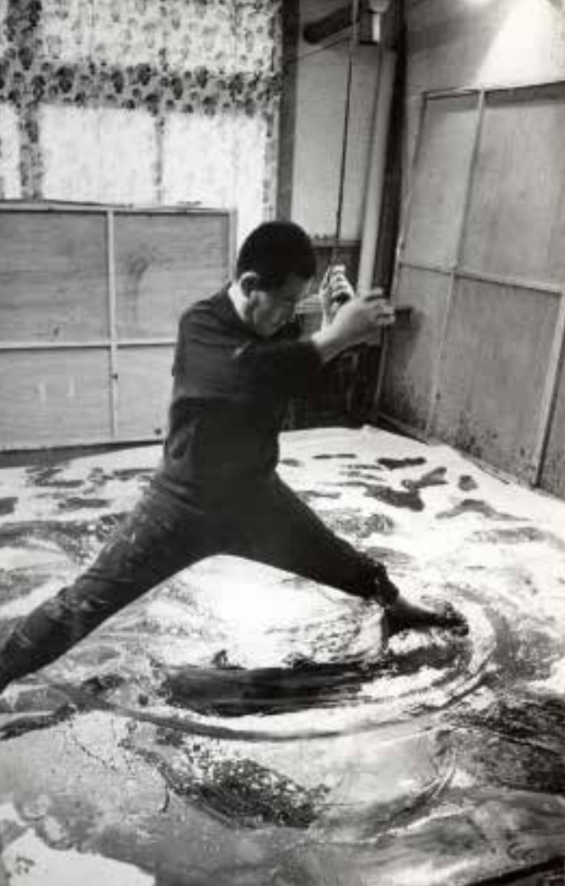
足で描く白髪一雄 1963年