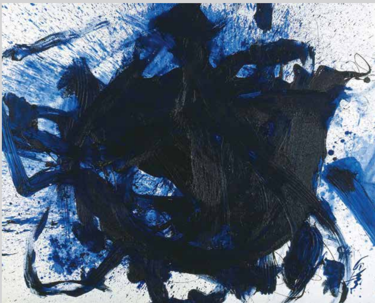
《群青》 1985年 尼崎市教育委員会蔵(市立尼崎高等学校)