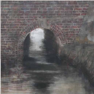
上「刻ノ痕跡」(2020年、改組新第7回日展特選)、右上「川辺」(2006年、学生時代の作品)、右中「帰還」(2019年、第3回新日春展奨励賞)、右下「痕跡」(2024年、日本画新展京都商工会議所会頭賞)、左上「刻ノ塔」(2013年、第48回日春展 奨励賞)、左中「刻」(2021年、第5回新日春展 奨励賞)、左下「刻」(2009年、第44回日春展 初入選)